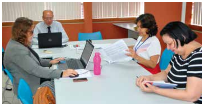
DIPREV finaliza, auditoria independente avaliação do exercício