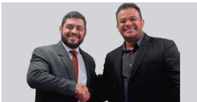
Amazonprev faz parceria com AADS para agilizar atendimentos