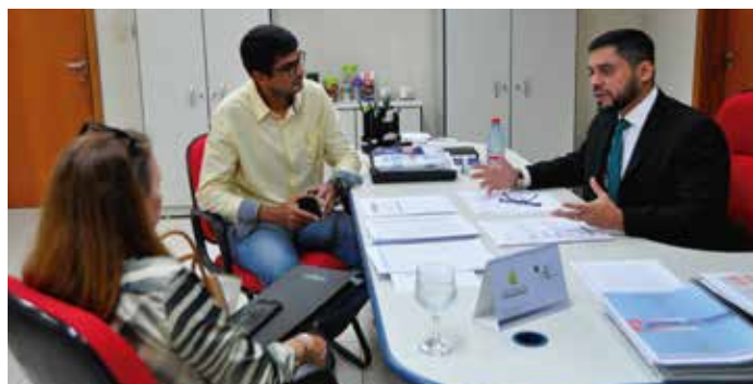
Parceria com SEC-AM para criação do Museu Amazonprev