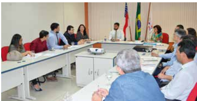
Reunião marca adesão do TJ-AM ao Sistema Previdenciário