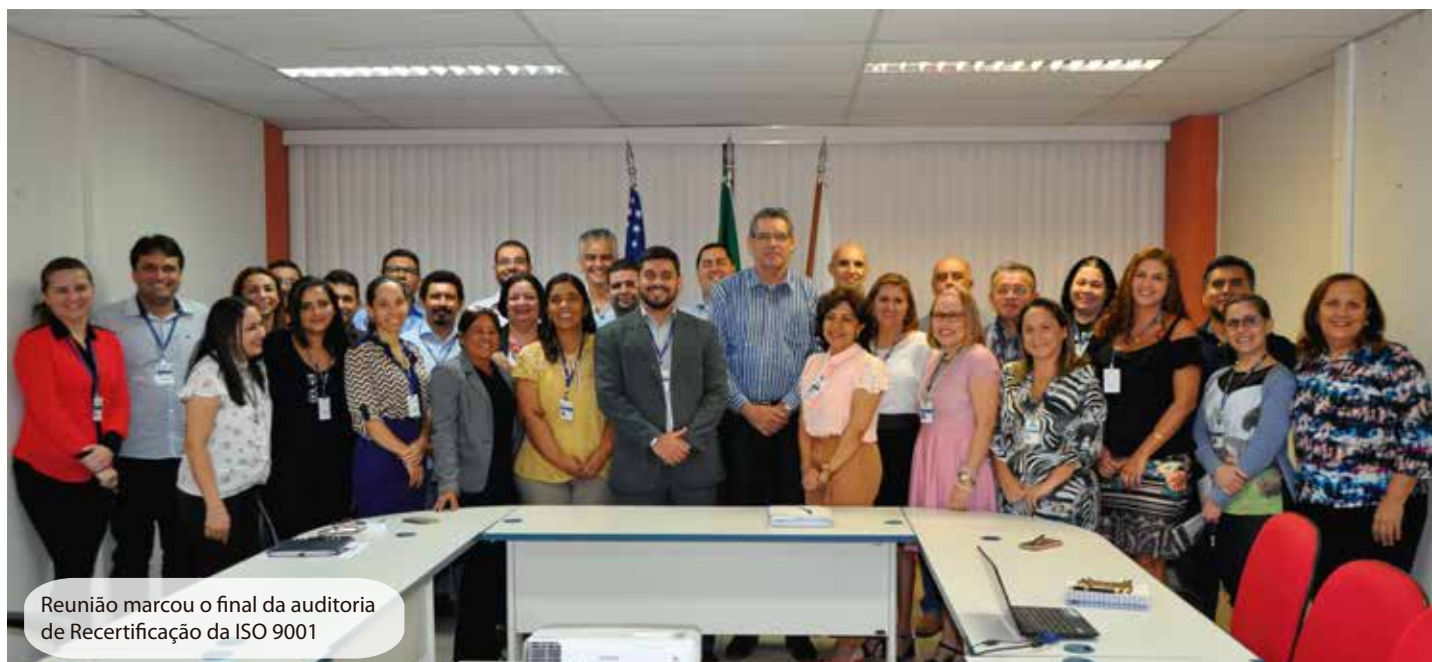
Reunião marcou o final da auditoria de Recertificação da ISO 9001