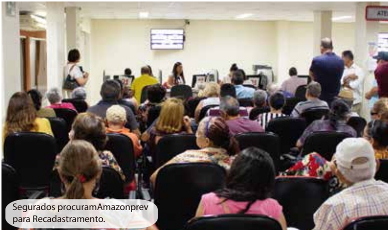
Segurados procuram Amazonprev para Recadastramento.