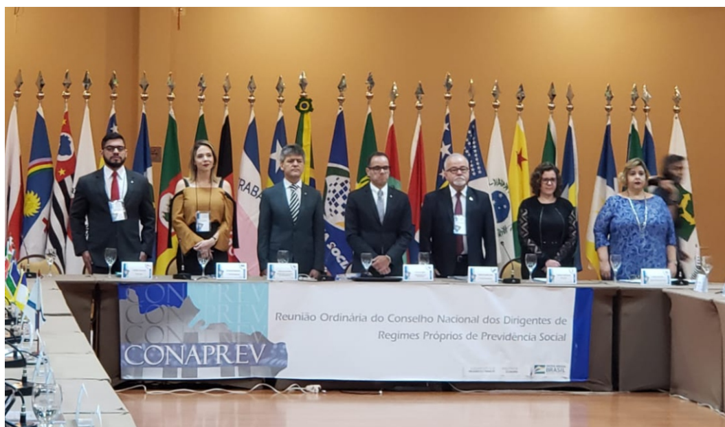
Abertura da 66ª Reunião Ordinária do Conselho Nacional dos Dirigentes de Regimes Próprios de Previdência Social (Conaprev), realizada nos dias 22 e 23 de julho