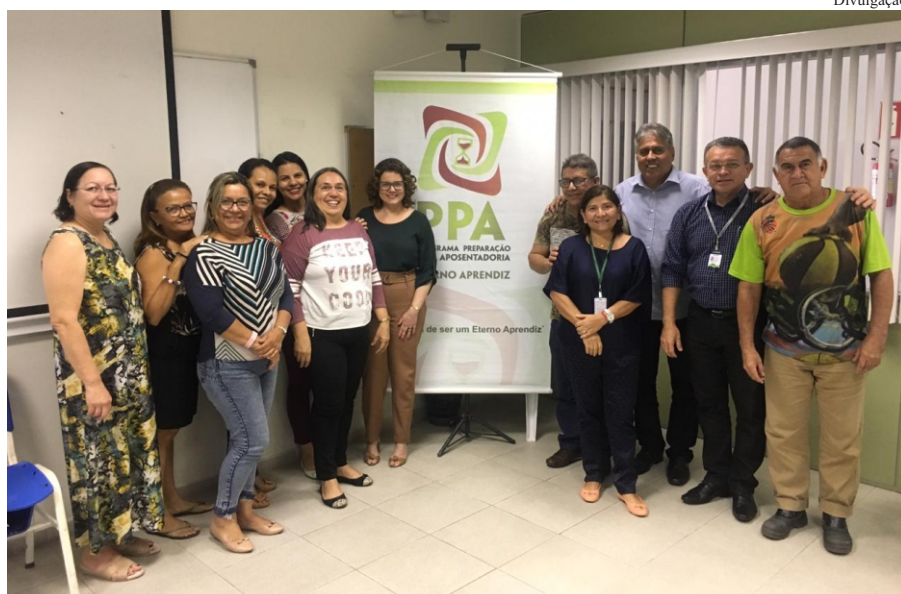
Servidores do TCE, Manausprev e INSS participaram da palestra da Amazonprev sobre processos previdenciários na Escola do Legislativo/ALE

O evento integra o Programa de Preparação para Aposentadoria (Proap) da Amazonprev, que apoia e orienta os servidores do Estado a encarar essa nova fase da vida por meio de palestras e oficinas que abordam módulos emocionais, sociais, organizacionais, legais, de saúde e cidadania.